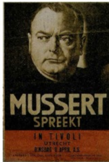
Affiche voor een spreekbeurt uit 1940.